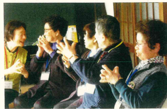
指先の体操で脳への刺激一杯です

年々人口が減少し高齢化が進む大川市。人生100年時代を迎え認知症や寝たきりになって通院したり介護をうけたりするよりも、そうならないように予防に力を入れて、高齢者が元気な大川市を作りたいという市長の熱い思いから、認知症やフレイル(心身機能の低下)予防を目