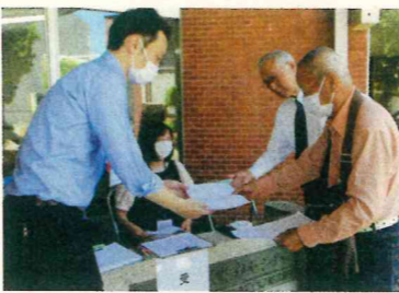
老人福祉センター玄関前で決意書を受け付ける龍野会長と事務局員