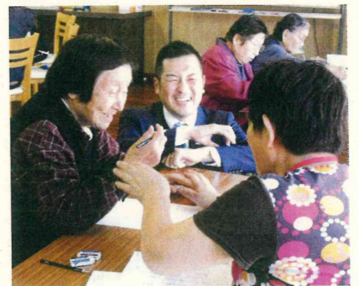
教材を使った学習の様子

年々人口が減少し高齢化が進む大川市。人生100年時代を迎え認知症や寝たきりになって通院したり介護をうけたりするよりも、そうならないように予防に力を入れて、高齢者が元気な大川市を作りたいという市長の熱い思いから、認知症やフレイル(心身機能の低下)予防を目