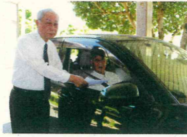
ドライブスルー形式で決意書を持参した会員

大川市老人クラブ連合会は5月13日、令和2年度の定期総会議案を可決しました。新型コロナウイルスの影響で、会場は設けず、あらかじめ配布していた議案書の表決書を回収する方法を取りました。