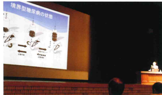
大ホールで開かれた講演会

を聞く（新しいことに挑戦）⑦新聞などをよく読む（世界に通じる）⑧口八丁・手八丁・足八丁（人生は24丁）⑨日記を書く（毎日ペンをとる）⑩硬いマットに寝る（背骨・腰を伸ばす）。 人間は生かされている存在です。周りが提供してくれる援助や配慮に、また毎日食べることができ有難さを感じることが大切で、食事のたびに心から「いただきます」や「ごちそうさま」と感謝することも大切です。