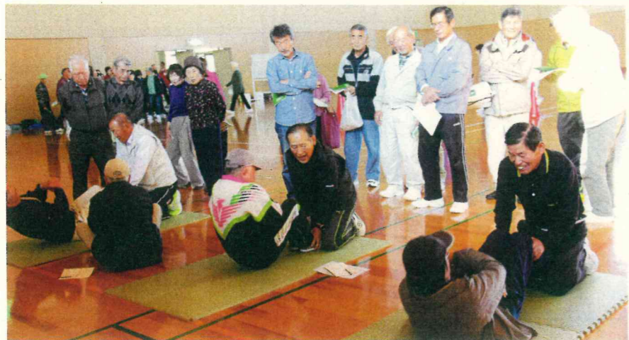
腹筋で「上体おこし」をする参加者