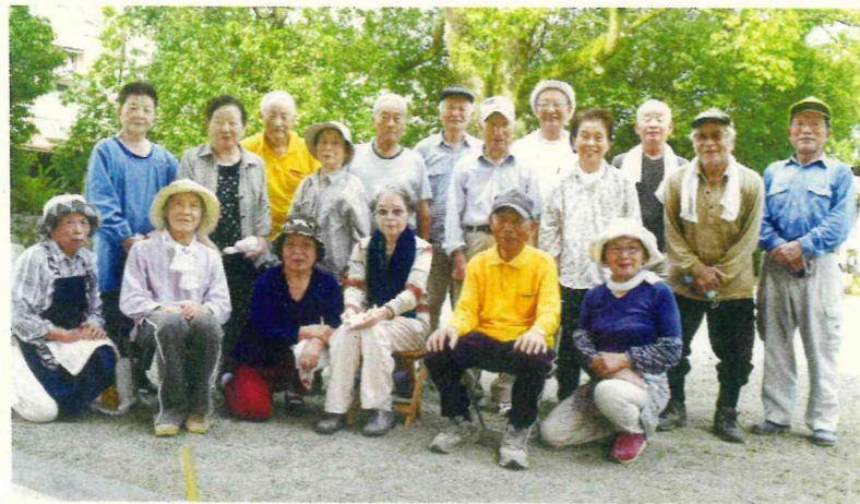
10 町内 第1友和会・宮内第2友和会