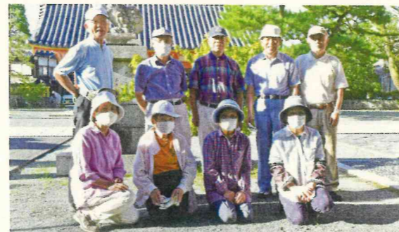
11 町内 第1睦会・中原第2睦会

は男性10名女性15名合計25名参加していただき、公民館の清掃及び、除草を行いました。公民館の清掃は女性の