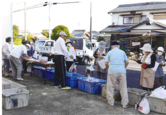
道海島第一長寿会