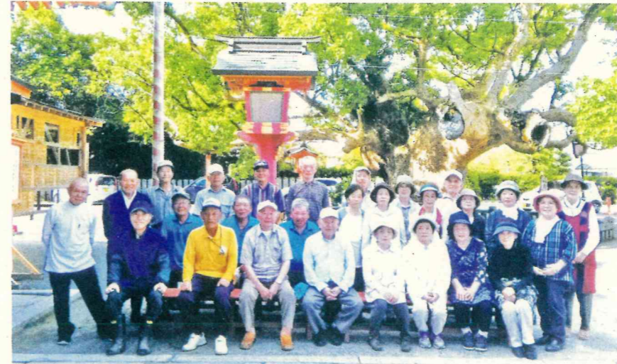
9 町内 楽友会・北酒見友楽会

います。北酒見楽友会、友楽会。宮内第1友和会、第2友和会。中原第1睦会、第2睦会