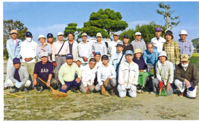
川口校区老人会 (下新田農村公園)

く作業が進み、1時間ほどで広々とした綺麗な公園となりました。 「日頃お世話になっている公園ですから」と参加者は仲間とふれあいながら「さわやかな汗」を流していました。