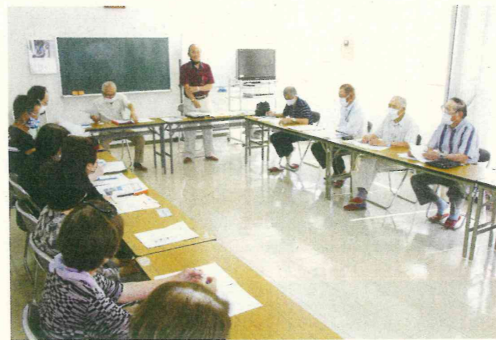
コミセンで開かれた三又老人会役員会

やすらぎとふれあいの旅は9月下旬に予定していたが11月29日から12月1日に変更されたことが報告された。三又校区では出発前、コミセンと諸富金物店に集合する。一斉社会奉仕活動は9月2日午前7時から同8時