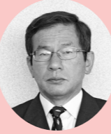
防災と花宗川改修について いちよう通りの延伸計画について 木室幼稚園の跡地活用について

答 昭和43年度に着手され、下流側から河道の拡幅、護岸の整備、橋梁の架け替え等が実施されて、筑後川合流部から酒見橋までの約3キロメートルが概成しています。現在は酒見橋から上流において護岸工事が行われています。