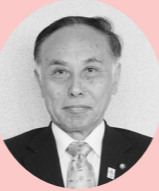
おおかわ寺子屋の現状と今後について フッ化物洗口の取り組みについて

参加しやすい環境としました。今後のおおかわ寺子屋の運営については、各中学校長を通じて生徒の参加を促し、引き続き、地域の皆様のご協力を得ながら取り組んでいきたいと考えています。 問 道海島小学校で実施されている虫歯予防のためのフッ化物洗口の取り組みに関して、今後、大川市内の全小学校への広がりについて伺いたい。 答 道海島小学校におけるフッ化物洗口の取り組みは、1年5か月が経過しており、本年2学期からは、事業の実施主体を県から市へ移行し、引き続き実施してまいります。今後は、市内の子ども達の健康増進の一環として、歯科医師会や学校関係者の協力をいただきながら、保護者の皆様のご理解を求め、市内全児童への実施に向けて検討していきたく思っています。