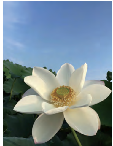
「大川れんこん」の れんこん畑 (三又校区・諸富)