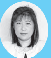
交通弱者に対する支援の拡大を 子供達に交通安全対策の強化を

答 改正道路交通法が平成29年3月に施行されており、消防団活動の円滑化を図るためにも、準中型免許取得の助成については、近隣自治体の状況も勘案しながら検討していきたいと考えています。