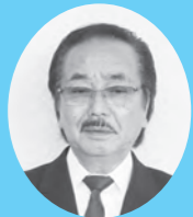
大川市近未来都市構想 「佐賀空港と福岡県南浮揚について」

答 佐賀江川左岸の堤防は車両が離合するにも困難な道路幅員のため、排水ポンプ車の配置ができない状況です。このため、本市では国土交通省筑後川河川事務所に対し、浸水被害対策の要望書を提出し、排水ポンプ車の配置のための堤防整備等の働きかけを行ってきましたが、その実現は非常に厳しいので、道海島地区の内水被害を軽減させる対策として、排水ポンプ施設を設置を検討していきたいと考えています。