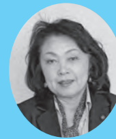
『高齢者介護予防事業』について

閲覧場所 議会事務局(市役所3階) 閲覧時間 8時30分~17時15分 (土・日、祝日、年末年始を除く)