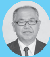
梅雨期及び台風期における 内水被害対策について