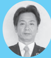
交通弱者への支援について 幼児教育・保育の無償化及び 教育の質の確保について 防災について

答 大川のインテリア産業や福岡県南地域がどう発展できるのかという思いで事業を進めており、佐賀県からのアプローチがなされているのが絶好の時と考えています。 問 大川の駅構想実現に向かって推進室長の意気込みを伺いたい。 答 両県が連携する中で、福岡県南地域の歴史、風土を踏まえたものづくりの歴史を情報発信できるものを整備する必要があると考えています。大川の駅構想の趣旨について、各界各層百人以上の方々にお話をしたところ、全ての方々に賛同をいただいています。