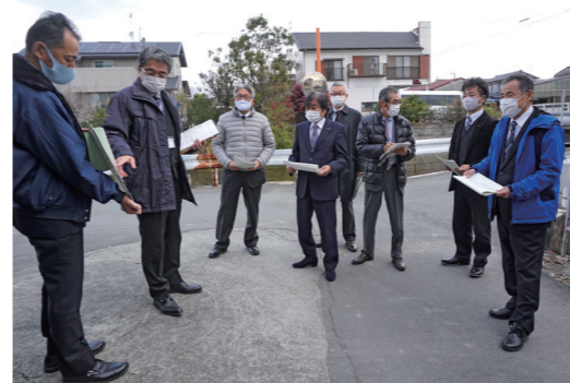
産業建設委員会による市道廃止現地調査

廃止予定の広木1号線及び広木3号線は、下木佐木地区の県道柳川城島線の広木橋から花宗川下流左岸側に入ったところに位置しています。この2路線は、花宗川改修事業の用地買収に伴い、一部が事業用地となり、一般交通の利用はなく、隣接する土地所有者の個人利用のみとなっていることから、関係者の同意を得て、市道認定を廃止するものです。