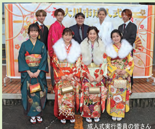
成人式実行委員の皆さん