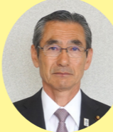
空家家の現状及び問題点とその取り組みは

意見 岡山市では、目視により、空き家の老朽・危険度をAからEの5段階でランク付けしており、AからCは空き家の適正な管理と利活用を目指し、DとEは老朽化した危険な空き家の対象として、除却等を求めるとしている。山形県酒田市では、自治会による空き家の見守り活動を行い、空き家や解体情報を市へ報告する取組をされている。参考にしてほしい。 問 福岡県宅建物取引業協会と「空き家等の適切な管理の促進に関する協定」を締結されたが、今後の取組を伺いたい。 答 無料で相談できる環境を整備し、相談後も引き続き相談者のニーズに合った対応策を講じるための協定であり、今後は空き地も含めた空き家等の利活用など、様々な対策に協会と連携して取り組むことで、周辺環境に悪影響を及ぼす恐れのある空き家等の発生を抑制し、安全で安心な住環境を構築していきたいと考えています。