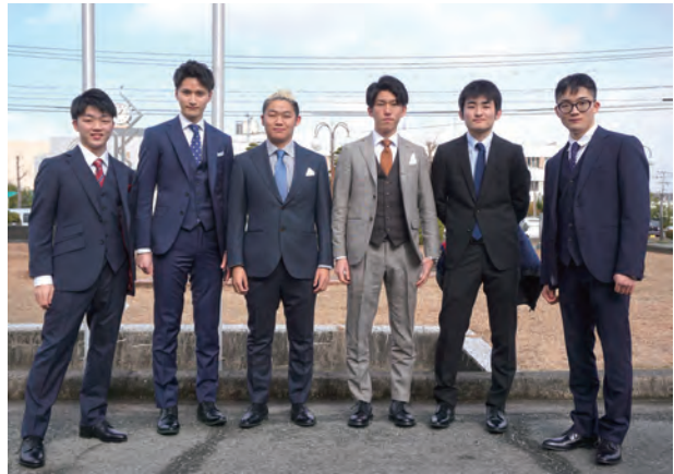
写真撮影時のみマスクをはずしていただきました