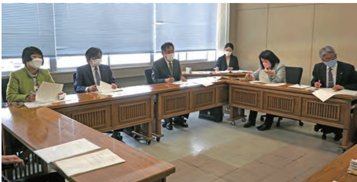
産業建設委員会による審査

答 平成18年度から令和2年度までの収納率は、97・62パーセントです。また、普及促進活動として、パンフレットの中でも、3年以内に公共下水道へ直接流す水洗トイレに改造しなければならぬ旨を明記しており、3年以内に接続さ