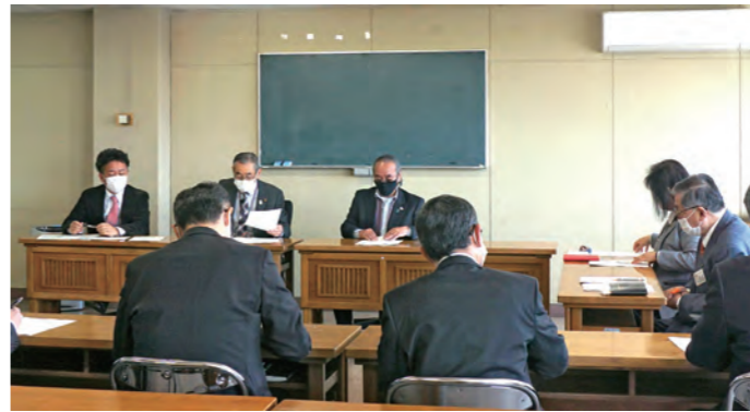
総務委員会による審査

ふるさと寄付金の増額に伴う謝礼品及び基金積立金にかかる経費並びに住民税非課税世帯等に対する臨時特別給付金等給付事業等にかかる経費。