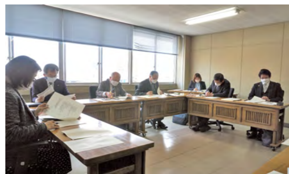
文教厚生委員会による審査

高齢者の医療の確保に関する法律に基づく医療事業等のうち、保険料徴収など本市が行うべき事業等の予算で、予算総額は6億4千500万円です。