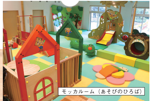
モッカルーム (あそびのひろば)