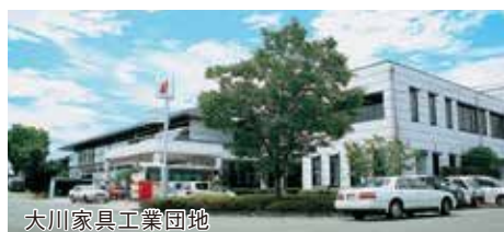
大川家具工業団地

連絡先:大川家具工業団地協同組合 事務所:大川市大字中古賀1048-1 TEL:0944-87-5151 FAX:0944-87-1145 E-mail:u-zone@u-zone.jp ホームページ:http://www.u-zone.jp