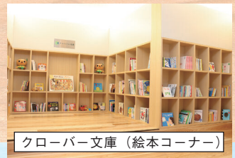
クローバー文庫 (絵本コーナー)