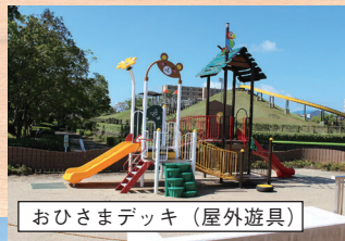
おひさまデッキ (屋外遊具)